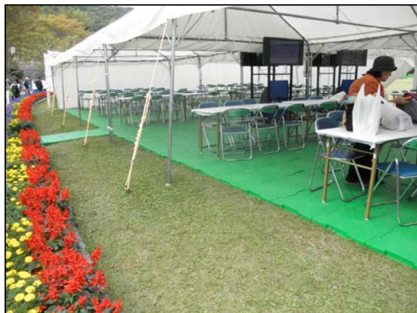
14.一般休憩所 (弓道会場)