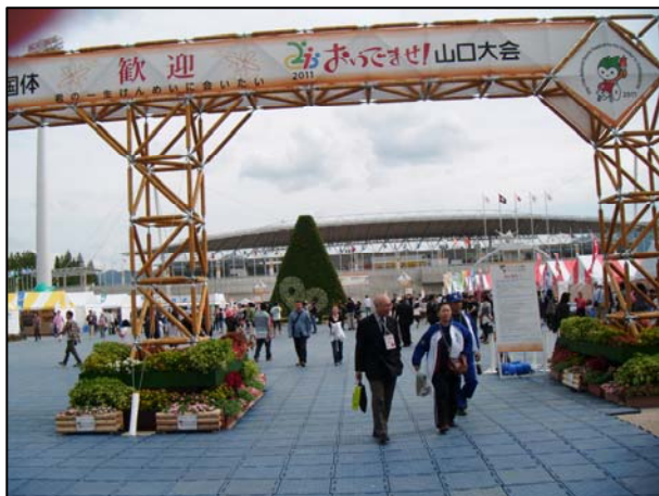
13.一般休憩所 (メイン会場)