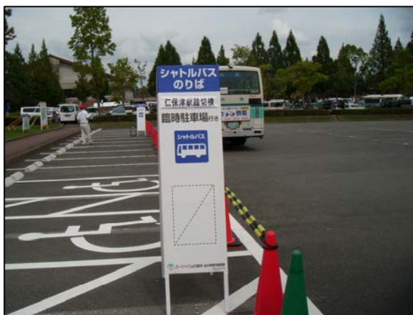
29.シャトルバス乗降所