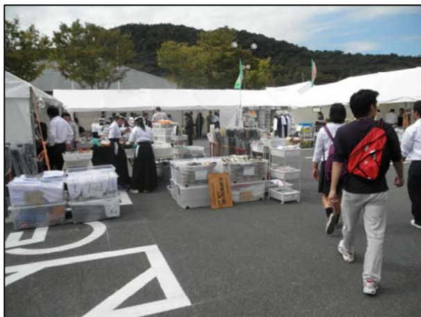
15.一般休憩所 (弓道会場)